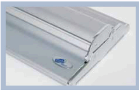
Roll Up Professional tiene un diseño más exclusivo, incluyendo cabezas de tornillos invisibles.