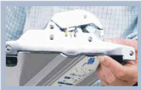
Para cambiar la imagen en Roll Up Professional, basta con hacer clic en un botón.

Roll Up Professional es un sistema de display algo más exclusivo, diseñado para uso repetido en todo tipo de entornos. Se monta completamente en menos de un minuto. El cambio de imagen resulta aún más fácil en Roll Up Professional, y se encuentra también disponible en versión de doble cara. Es la elección ideal para cualquier evento.